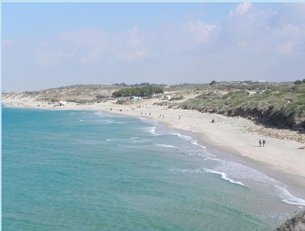
חוף פלמחים

בהחלטתה מדגישה הוועדה שעל התכנית לכלול בהוראותיה התייחסות לשימור המצוק לפי תמ"א 9/13 ולהבהיר בהוראותיה איסור חסימת מעבר חופשי של הציבור אל החוף ולאורכו.